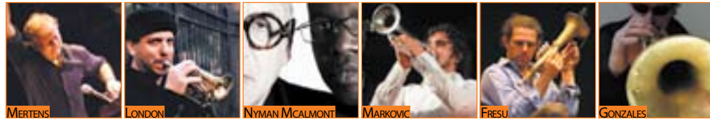
Direzione artistica: Stefano Di Battista e Michele Torpedine