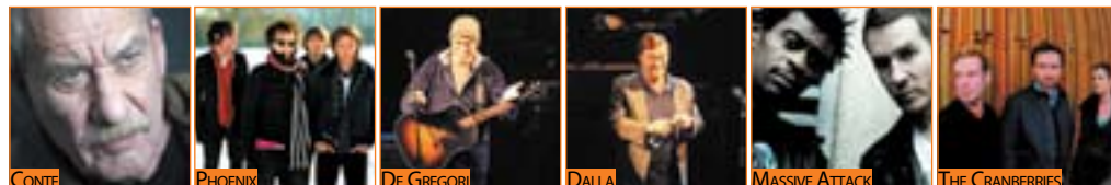
Direzione artistica: Michele Torpedine